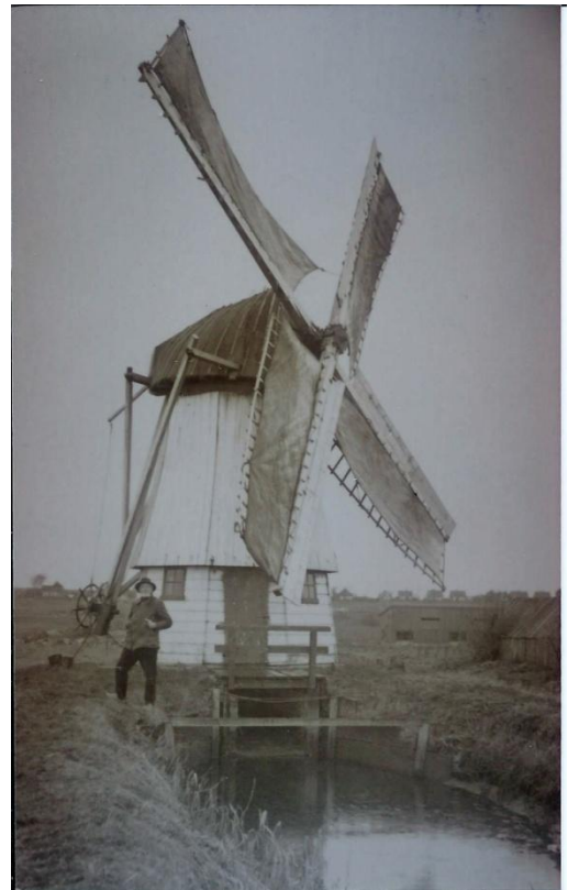
De witte molen van de Westerlanderkoog

De witte molen van de Westerlanderkoog stond vlak bij de Haukes. De molen was een buitenkruier met een rieten kap en een vijzel met een diameter van 1,63 meter doorsnede. Dat is goed te zien aan de waterlopen die in het midden van de molen uitkomen, een onmiskenbaar kenmerk voor een vijzelmolen. Het is niet helemaal duidelijk wanneer dit molentje is gebouwd. In de database van verdwenen molens staat aangegeven dat de molen gebouwd is tussen 1864 en 1894, wat natuurlijk een erg groot tijdvak is. Deze molen waarschijnlijk is gebouwd rond 1855, aangezien op een kaart van F. Allan een molen bij de Haukes staat getekend. Maar het lijkt erop dat die later is ingetekend. In het Regionaal Archief Alkmaar zijn wel stukken van het Heemraadschap Wieringen te vinden uit de periode 1883-1980 en het Dijk- en Polderbestuur van voor 1882. Mogelijk is daarin meer te vinden over het bouwjaar. Het is de moeite waard om daar later nog eens in te duiken.