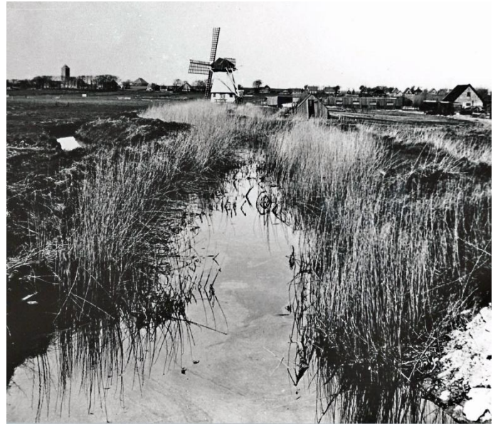
De Witte Molen aan de afwateringsloot nabij de Haukes